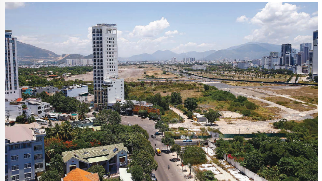
Thị trường đang ghi nhận tín hiệu cải thiện nguồn cung khi có thêm dự án "rục rịch" chuyển động

Xét về tổng thể, từ đầu năm đến nay, tình hình nguồn cung, đặc biệt là các sản phẩm nhà ở xã hội, nhà ở giá bình dân, chưa thực sự được giải quyết một cách triệt để. Tuy nhiên, thị trường đã ghi nhận tín hiệu tích cực ngày càng rõ nét theo thời gian. Đơn cử, vào cuối quý II và đầu quý III đã xuất hiện thông tin các dự án mở bán tại một số địa phương như TP.HCM, Hải Phòng.