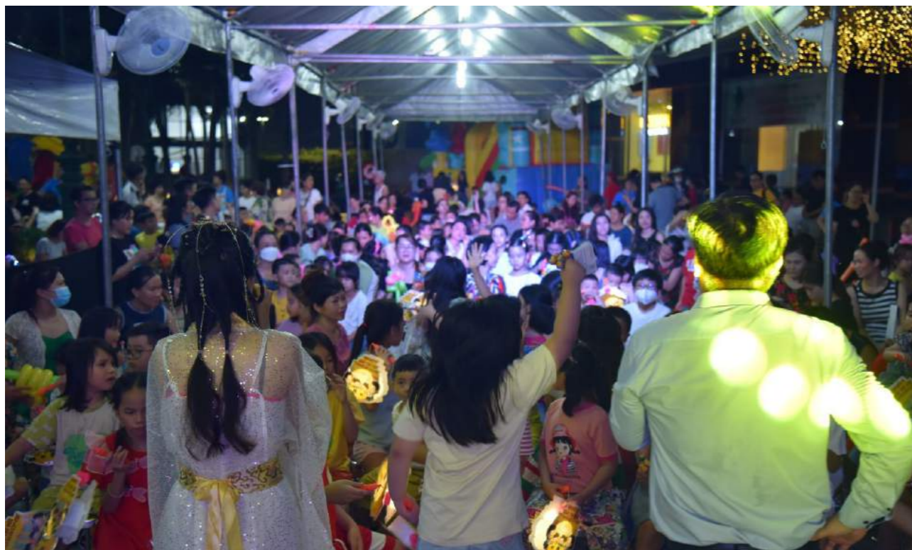
Không khí nhộn nhịp ngày Trung thu tại các Khu căn hộ của Him Lam Land

Chào mừng Trung thu là sự kiện thường niên do Công ty Cổ phần Kinh doanh Địa ốc Him Lam (Him Lam Land) cùng Ban Quản trị, Ban Quản lý các Khu căn hộ phối hợp tổ chức. Chương trình năm nay còn nhận được sự quan tâm và đồng hành của nhiều đơn vị tài trợ vàng – bạc – đồng với nhiều phần quà mang giá trị thiết thực cho các bạn nhỏ.