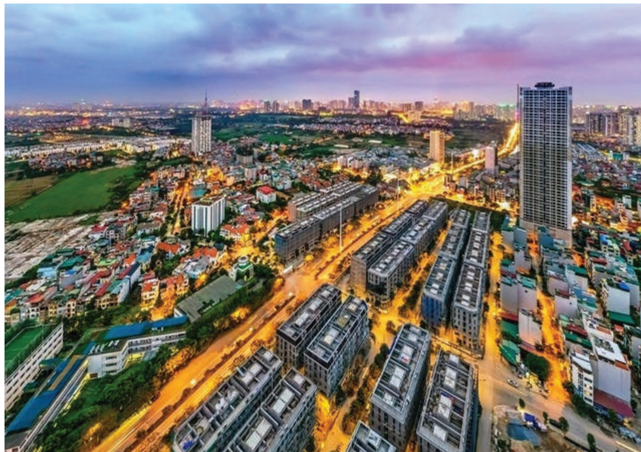
Mọi chính sách nhằm để xây dựng một thị trường BĐS lành mạnh, thực sự là động lực góp phần thúc đẩy phát triển kinh tế - xã hội

PV: Ở góc nhìn của một người nghiên cứu chuyên sâu lĩnh vực pháp lý BĐS, xin ông cho biết quan điểm của mình về việc tạo lập “thị trường BĐS/ đất đai theo định hướng xã hội chủ nghĩa”?