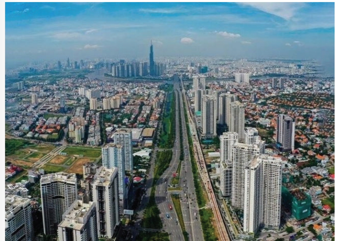
Tiếp cận chính sách đất đai, BĐS cần đồng bộ và thống nhất, thiết thực