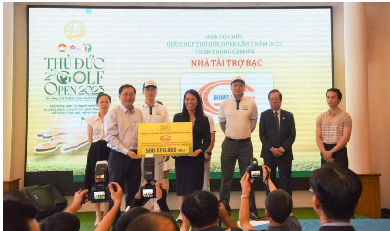
144 golfer tham dự Giải Golf "Tôi yêu Việt Nam"

hoàn cảnh khó khăn trên địa bàn thành phố Thủ Đức. Luôn đề cao trách nhiệm xã hội, Công ty Him Lam Land đã và đang đồng hành cùng các hoạt động thiện nguyện nhân văn mang ý nghĩa thiết thực, hướng đến mục tiêu lan tỏa những giá trị to lớn cho cộng đồng.