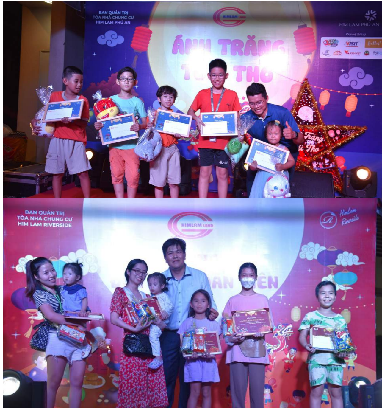
BTC trao thưởng cho cư dân nhí có tác phẩm lồng đèn xuất sắc tại Khu căn hộ Him Lam Phú An và Him Lam Riverside

như cắt dán để làm nên chiếc lồng đèn đẹp như ý và rực rỡ màu sắc cho riêng mình. Những sản phẩm gửi về BTC đều mang màu sắc riêng, nhiều bé còn sáng tạo, sử dụng vật liệu tái chế để làm nên tác phẩm lồng đèn ấn tượng.