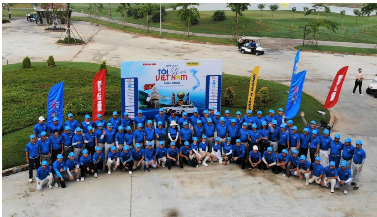
144 golfer tham dự Giải Golf “Tôi yêu Việt Nam”

những màn tranh tài đầy kịch tính, giải đấu đã tìm ra được những người chiến thắng, chủ nhân danh giá cho những phần thưởng rất có giá trị của giải.