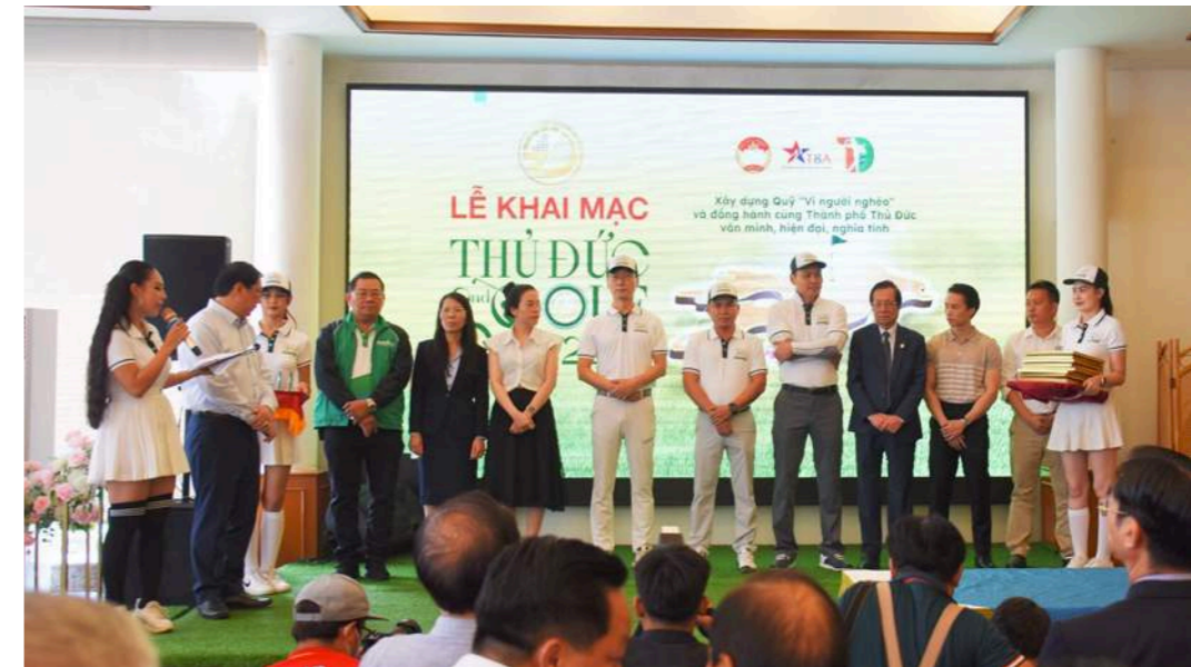
Sau hơn 1 tháng phát động, Giải Golf Thủ Đức Open lần thứ 2 đã nhận được tổng số tiền là 35 tỷ đồng đóng góp vào Quỹ