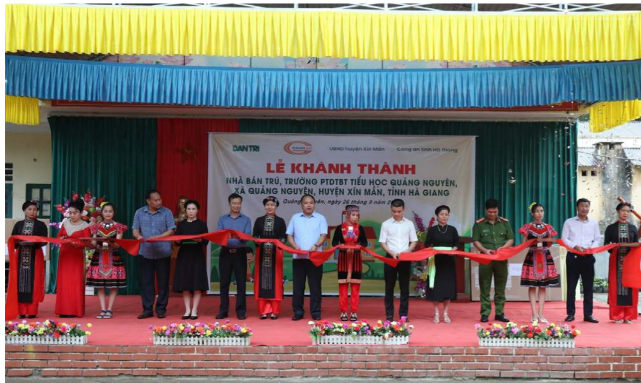
Lễ khánh thành công trình nhà bán trú Trường Phổ thông Dân tộc Bán trú (PTDTBT) Tiểu học Quảng Nguyên, huyện Xín Mần, Hà Giang

hoạt bán trú tại trường. Đây là công trình nằm trong chuỗi hoạt động Chương trình Nhân ái của báo Dân trí tham gia đồng hành cùng Him Lam Land.